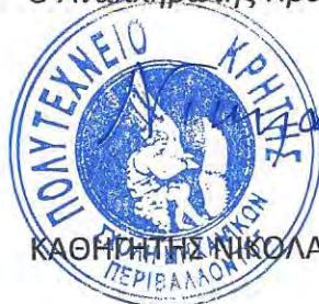
ΚΑΘΗΓΗΤΗΣ ΝΙΚΟΛΑΟΣ ΝΙΚΟΛΑΪΔΗΣ

Ο Αναπληρωτής Πρύτανη και Πρόεδρος της Επιτροπής Ερευνών